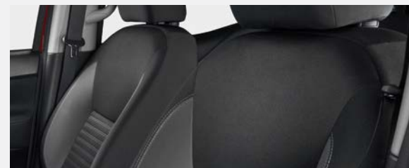
ASSENTOS DE TECIDO (Modelo SE Plus, XE de Cabine Unica*) *Opcao de vinil cinzento disponivel