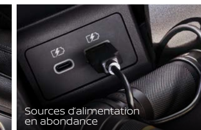
Sources d'alimentation en abondance