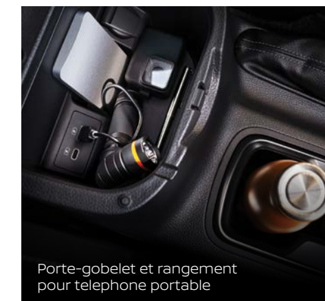
Porte-gobelet et rangement pour téléphone portable