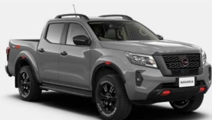
Gris guerrier (PM) - KBY Disponible uniquement sur PRO-4X

Les modèles PRO-2X et PRO-4X sont disponibles dans les coloris suivants : Blanc (S) - QM1, Rouge (S) - AX6, Noir Infini (S) - KH3 et Gris Guerrier (PM) - KBY