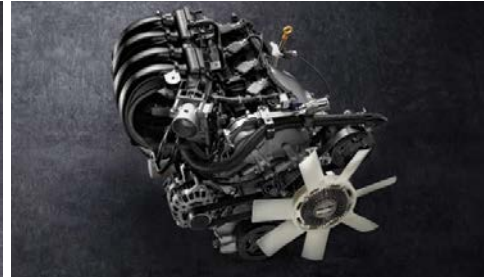
MOTEUR ESSENCE 2.5ℓ A INJECTION MULTIPOINT DANS LE COLLECTEUR D'ADMISSION

Choisissez entre l'économie parfaite d'essence et le couple du moteur diesel turbocompressé sur l'ensemble de la gamme Navara. Des moteurs de différentes puissances sont désormais proposés tant pour la version essence que pour la version diesel en vue de répondre à tous les besoins professionnels ou de loisirs. Avec une transmission automatique à 7 rapports ou une transmission manuelle à 6 rapports, soyez assurés de disposer de toute la puissance vous permettant de transporter et de remorquer des charges ou conduire lorsque vous en avez le plus besoin.