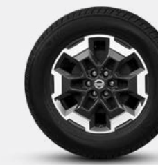
18" ALLIAGE (Grade LE Plus)