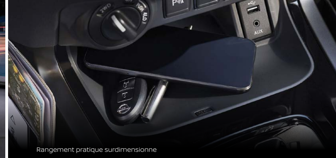
Rangement pratique surdimensionné

La forme rencontre la fonction lorsque vous découvrez comment la cabine du Navara a été soigneusement conçue pour s'intégrer parfaitement à chaque moment, que ce soit pour le travail, les loisirs ou la détente. Des espaces de rangement généreux, un rangement pour lunettes de soleil, une boîte à gants surdimensionnée et de multiples points de charge font du tout nouveau Navara le compagnon idéal pour la vie quotidienne.