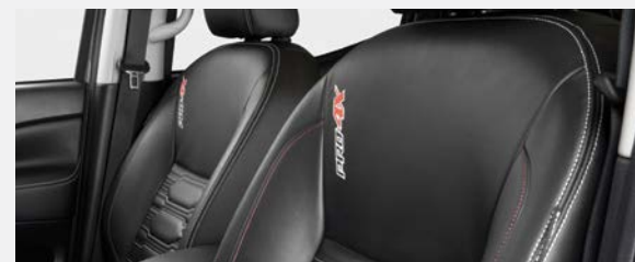
SIEGES EN CUIR NOIR (Modele PRO-4X)