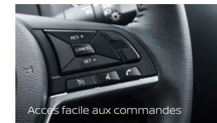
Accès facile aux commandes

Le Navara optimise le rangement à l'intérieur comme à l'extérieur. Les sièges arrière offrent un espace de rangement sécurisé sous le siège et peuvent être relevés pour faciliter le transport d'objets plus hauts.