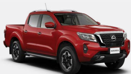
Rouge (S) - AX6