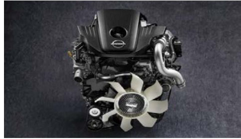
MOTEUR DIESEL 2.5ℓ DDTI INTERCOOLED TURBO

Le tout nouveau Navara combine puissance et intelligence de manière à vous donner la confiance nécessaire pour conquérir tous les terrains accidentés, ainsi que les rues de la ville et les routes dégagées. Construit spécialement pour les conditions uniques et implacables de l'Afrique, ce pick-up au style audacieux et à la technologie avancée arrive avec un équipement complet pour que vous et vos proches restiez connectés, en sécurité et à l'aise, peu importe où la route vous mène.