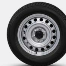
16 PO EN ACIER (CAB SIMPLE)