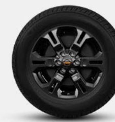
17" ALLIAGE (PRO-4X)

L'engagement de Nissan envers la qualité: Afin d'assurer un niveau de qualité élevé et constant à tous ses clients, Nissan applique cette norme globalement, afin que tous les propriétaires de véhicules Nissan aient l'esprit tranquille tout au long de la vie de leur véhicule. L'approche basée sur la qualité du point de vue du client est centrée sur trois éléments clés : Premièrement, l'attente d'une expérience de conduite en toute tranquillité. Deuxièmement, l'attrait intangible d'un véhicule, son pouvoir de captiver et d'exciter, avec des caractéristiques qui captent l'attention et l'imagination et troisièmement, le niveau d'attention et de service au cours du processus de vente, et longtemps après sa vente.