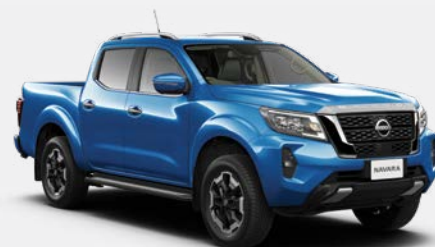
Bleu (M) - B16