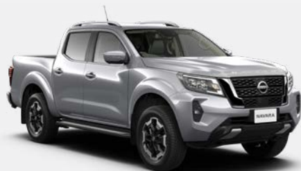
Argent (M) - KY0