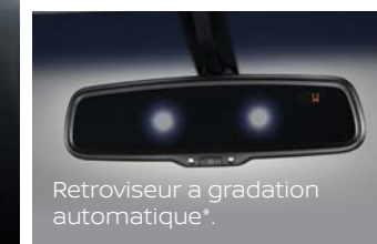
Retroviseur à gradation automatique*