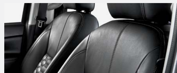
SIEGES EN CUIR NOIR (Modele LE Plus)