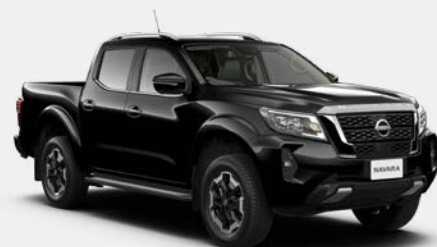
Noir Infini (S) - KH3