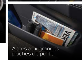
Accès aux grandes poches de porte

*DISPONIBLE SUR DES MODELES SELECTIONNES.