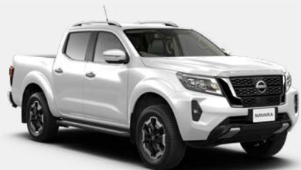
Blanc (S) - QM1