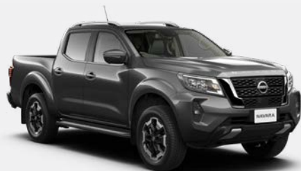
Gris Techno (M) - KY5