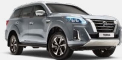
Argent - K23