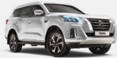
Blanc - QX1