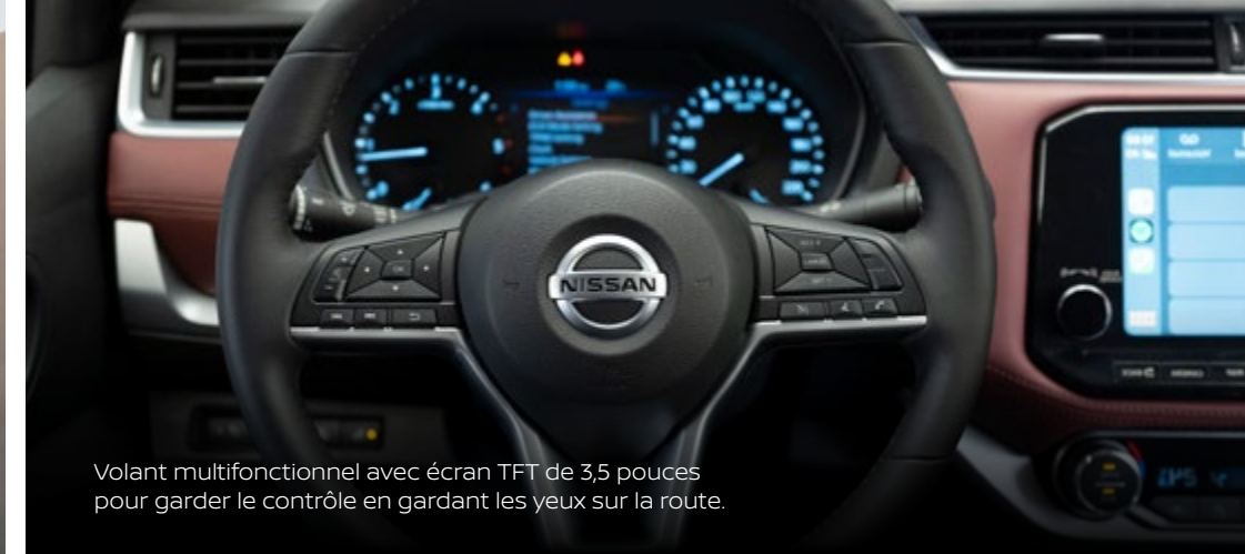
Volant multifonctionnel avec écran TFT de 3,5 pouces pour garder le contrôle en gardant les yeux sur la route.

Embarquez pour vos aventures quotidiennes dans un confort inégalé. Attendez-vous à un cockpit et à un tableau de bord élégants, avec des sièges en cuir, un volant et un levier de vitesse en cuir. Contrôlez tous les systèmes d'infodivertissement depuis le volant multifonction et laissez les sièges de la rangée avant à gravité zéro, inspirés par la NASA, vous aider à réduire la fatigue sur les longs trajets.