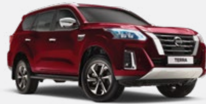
Rouge S - AX6