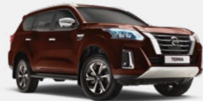
Brun - CAU