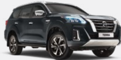
Gris - K21