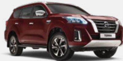
Rouge foncé - NAW