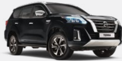
Noir - G42